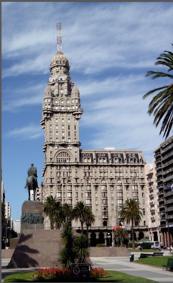
Plaza Independencia, Montevideo - URUGUAY

DESCARGO DE RESPONSABILIDAD: Este documento no está preparado por abogados o expertos en inmigración. Es una guía amateur preparada por venezolanos para venezolanos con ánimos de ayudar y fomentar la cooperación mutua.